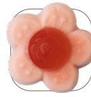
Himbeere mit Cassis