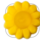
Mango mit Maracuja

Ihr optionaler Beitrag für die Umwelt – jeweilige Aufpreise auf Anfrage