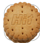
Keks mit Kakaocreme-Füllung

Inhalt: 1 Stück Grammatur: ca. 7 g Format: 45 x 72 mm Verpackungseinheit: 250 Stück Folie: weiße Folie Druck: 4c Euroskala