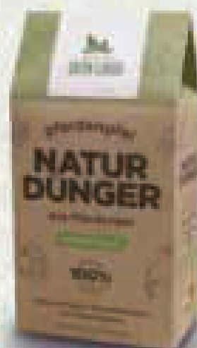
Beutelschachtel gefüllt mit Dünger