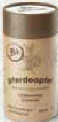
Runddose gefüllt mit Dünger