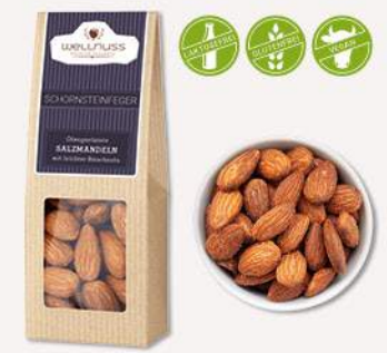
SCHORNSTEINFEGER (60 g) Ofengeröstete Mandeln mit leichter Rauchnote Diese Mandel wird mit einer Prise geräuchertem Salz veredelt.