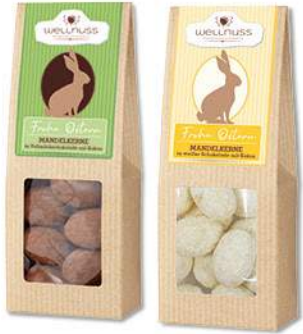
Faltschachteln ab Seite 14

Ab 100 Stück mit Deinem Motiv auf dem Säckchen