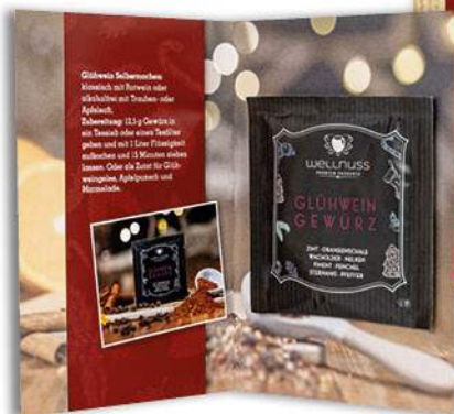
Klappkarte mit einem Portionsbeutel Seite 36