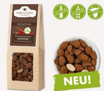
ROCKSTAR (70 g) Karamellierte Erdnüsse mit Chili, Meersalz und Kakao Scheinwerfer an! Die Kombination aus Kakao, scharf, süß und salzig ist ein echter Hit!