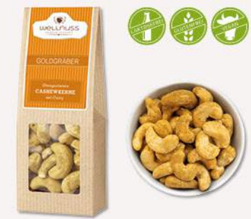
GOLDGRÄBER 60 g) Ofengeröstete Cashewkerne mit Curry Bei der fettarmen Röstung wird ein feiner Currymantel um die Kerne gelegt.