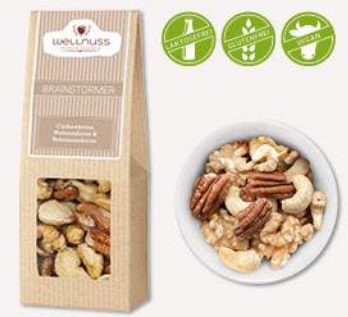
BRAINSTORMER (60 g) Cashewkerne, Walnusskerne und Pekannusskerne Herbe Walnüsse, süßliche Cashewkerne und edle Pekannusskerne in ihrer reinsten Form ergeben ein knackiges Genussstro.