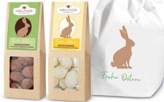
Baumwollsäckchen mit Faltschachteln ab Seite 18

Ab 100 Stück mit Deinem Motiv auf dem Säckchen