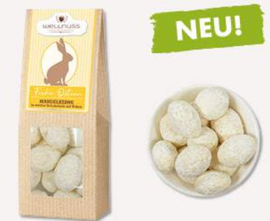
MANDELKERNE IN WEISSER SCHOKOLADE MIT KOKOS (60 g) Hier kommt ein Kokos-Snack in der perfekten Mini-Osterei-Form. Und mit einem Geschmack, der harmonisch die Süße der weißen Schokolade, die Aromatik der Kokosflocken und die herbe Mandelnote verbindet.