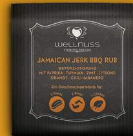
Jamaican Jerk BBQ Rub