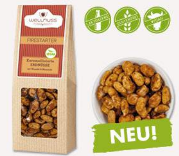
FIRESTARTER (70 g) Karamellierte Erdnüsse mit Wasabi Einfache eine neue Leidenschaft – für die Schärfe echten Wasabis auf süß ummantelten Erdnüssen.