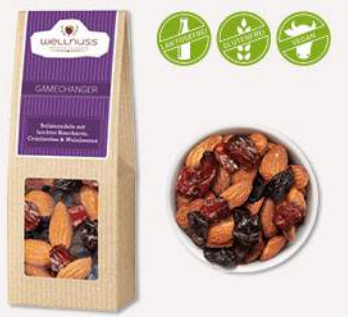
GAMECHANGER (60 g) Salzmandeln, Cranberries und Weinbeeren Lass Dich inspirieren von einer ungewöhnlichen guten Kombination aus Weinbeeren, Cranberries und salzig-rauchigen Mandeln.