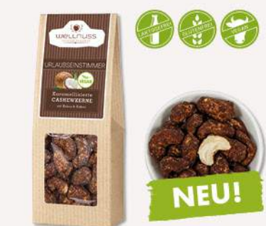
URLAUBSEINSTIMMER (60 g) Karamellierte Cashewkerne mit Kokos und Kakao Kokos küsst Kakao und macht den Schreibtisch zur Beach Bar.