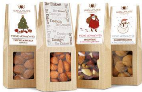
Faltschachteln ab Seite 14