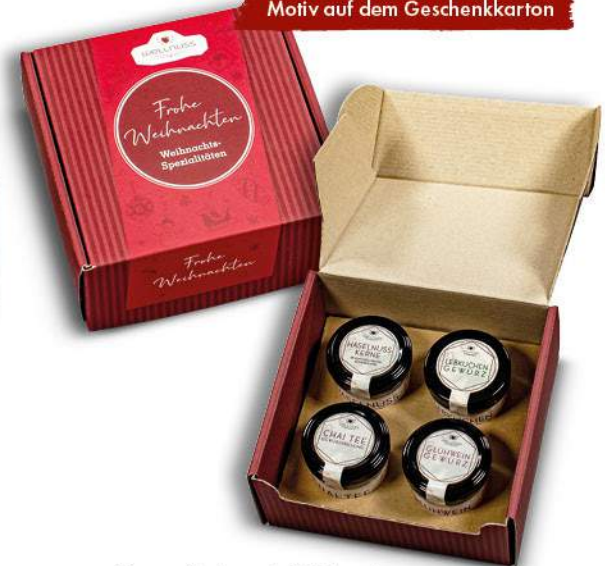
Kartondisplay mit Weihnachtsgewürzen im Glas ab Seite 40

Ab 100 Stück mit Deinem Motiv auf dem Geschenkkarton