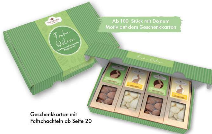
Geschenkkarton mit Faltschachteln ab Seite 20

Ab 100 Stück mit Deinem Motiv auf dem Geschenkkarton