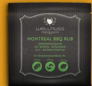
Montreal BBQ Rub