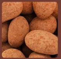
GLÜCKSBRINGER Trüffelmandeln mit Kakao