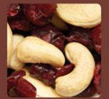
ENERGIESPENDER Cashewkerne & Cranberries getrocknet