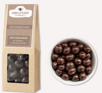
WACHMACHER (60 g) Kaffeebohnen in Zartbitterschokolade Die Schokoladenschicht ist gerade so dick, dass sie gegen das Kaffeearoma besteht, es jedoch nicht erdrückt oder verfälscht.