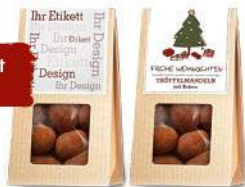
Minifaltschachteln ab Seite 16

Ab 100 Stück mit Deinem Motiv auf dem Geschenkkarton