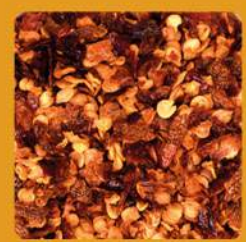
Birds Eye Chili

Alle Gourmet-Gewürze findest Du auf Seite 46/47