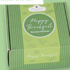
Geschenkkarton mit Gewürzgläsern ab Seite 40