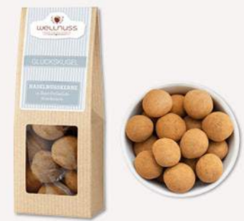
GLÜCKSKUGEL (60 g) Haselnuskerne mit Vollmilchschokolade und Zimt Über knackige Haselnüsse spannt sich ein Mantel aus belgischer Schokolade, bestäubt mit feinstem Zimt.