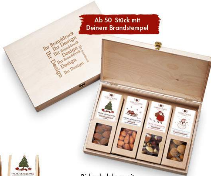
Birkenholzbox mit Faltschachteln ab Seite 22