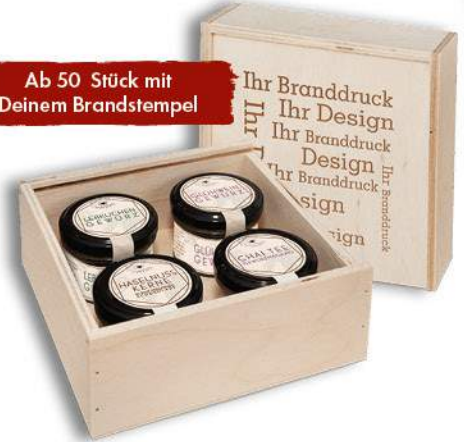
Gourmetkästchen Seite 42