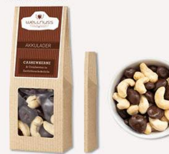
AKKULADER (70 g) Cranberries in Zartbitterschokolade und Cashewkerne Doppelte Geschmackpower: Zartbitterschokolade für die Seele, Cashewkerne für den Crunch.