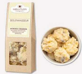
SEELNMASSEUR (70 g) Schoko-Crispies mit weißer Schokolade Weiße Schokolade, Kürbiskerne, Cornflakes und Erdbeerstückchen – Balsam für die Seele.