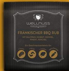
Fränkischer BBQ Rub