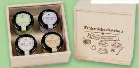
Gourmetkästchen ab Seite 42