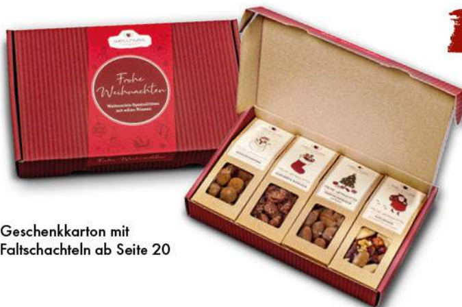
Geschenkkarton mit Faltschachteln ab Seite 20

Ab 100 Stück mit Deinem Motiv auf dem Geschenkkarton