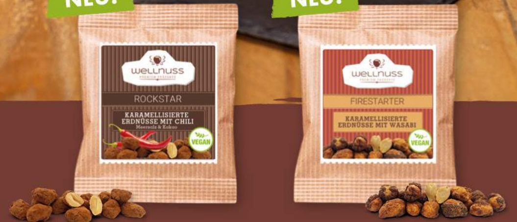
ROCKSTAR Karamellierte Erdnüsse mit Chili, Meersalz und Kakao