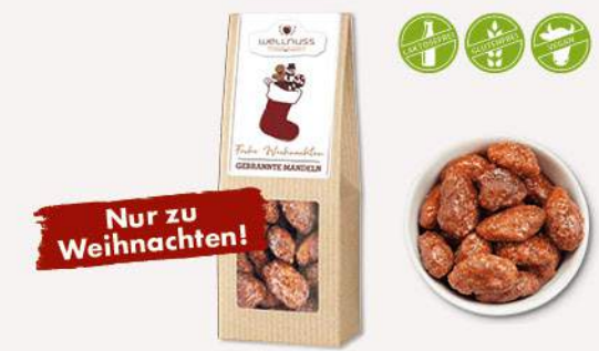
GEBRANNTE MANDELN MIT EINEM HAUCH ZIMT (60 g) Der leichte Karamellduft versetzt Genießer direkt auf den Weihnachtsmarkt.