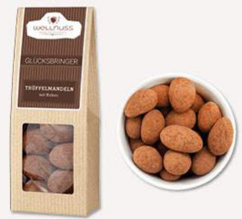
GLÜCKSBINGER (70 g) Trüffelmandeln mit Kakao Ein Mandelkern, umhüllt von feinsten belgischer Schokolade, bedeckt mit einem Hauch Kakaopulver.