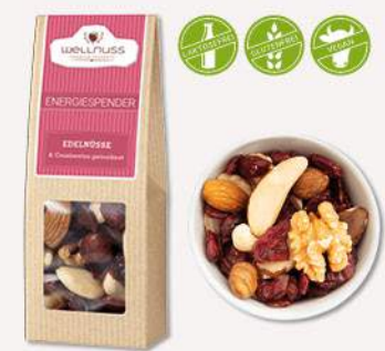
ENERGIESPENDER (70 g) Edelnüsse und Cranberries Süßliche Cashews, herbe Mandeln und aromatische Walnüsse spielen mit der leichten Säure schonend getrockneter Cranberries.