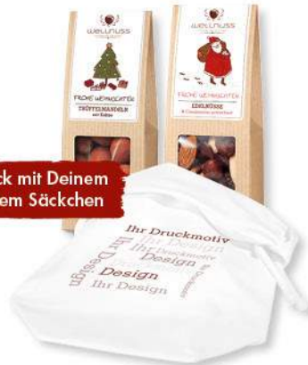
Baumwollsäckchen mit Faltschachteln ab Seite 18

Ab 100 Stück mit Deinem Motiv auf dem Säckchen