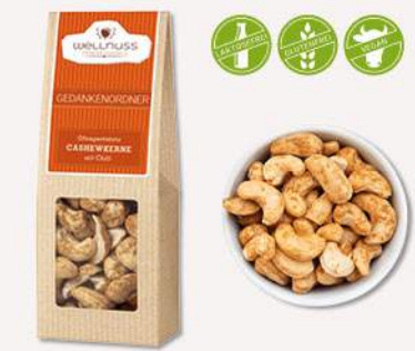
GEDANKENORDNER (60 g) Ofengeröstete Cashewkerne mit Chili Bei der fettarmen Röstung wird ein feiner Chilimantel um die Kerne gelegt.