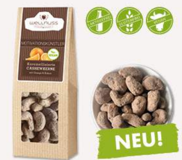
MOTIVATIONSKÜNSTLER (60 g) Karamellierte Cashewkerne mit Orange und Kakao Orange küsst Kakao und sorgt für beste Stimmung.