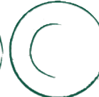
Dessertteller Cup (Ø 20 cm) TDCU20