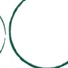
Suppenteller Cup (Ø 20 cm) TSCU20