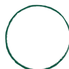
Unterteller Kaffee Cup (Ø 15 cm) TUCU15