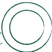
Suppenteller Gourmet (Ø 24 cm) TSGO24