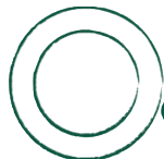
Unterteller Kaffee Gourmet (Ø 16 cm) TUGO16