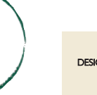
Speiseteller Cup (Ø 25 cm) TFCU25